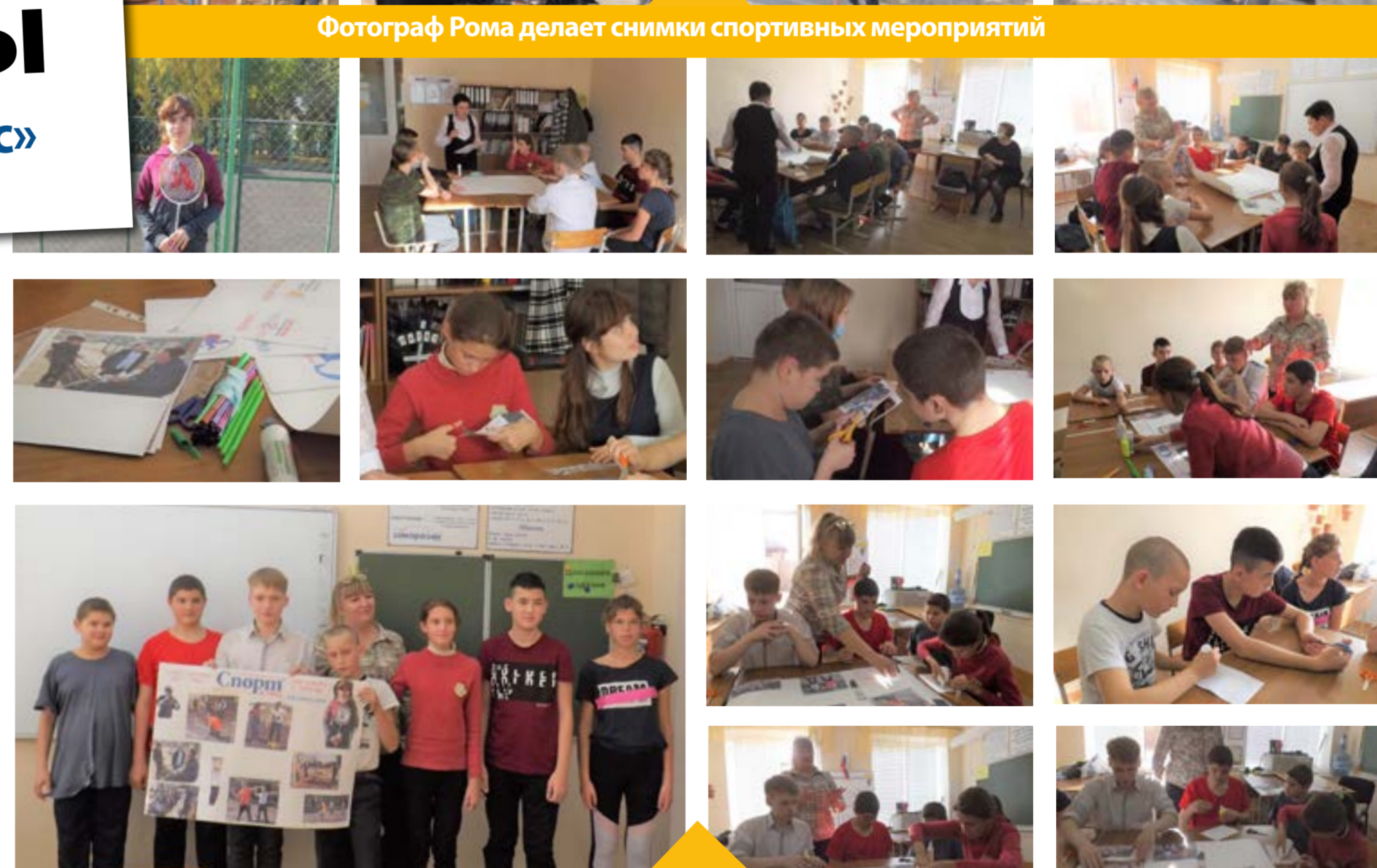
Клуб юных журналистов делает спортивную стенгазету