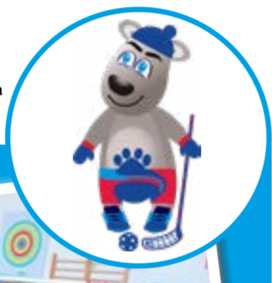
ШСК «СТАРТ» школьный спортивный клуб ГБОУ СО «Школа-интернат АОП п. Алексеевка Хвалынского р-на»