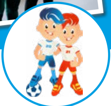
ШСК «ДРУЖБА» школьный спортивный клуб ГБОУ СО «Школа-интернат АОП №5 г. Саратов»