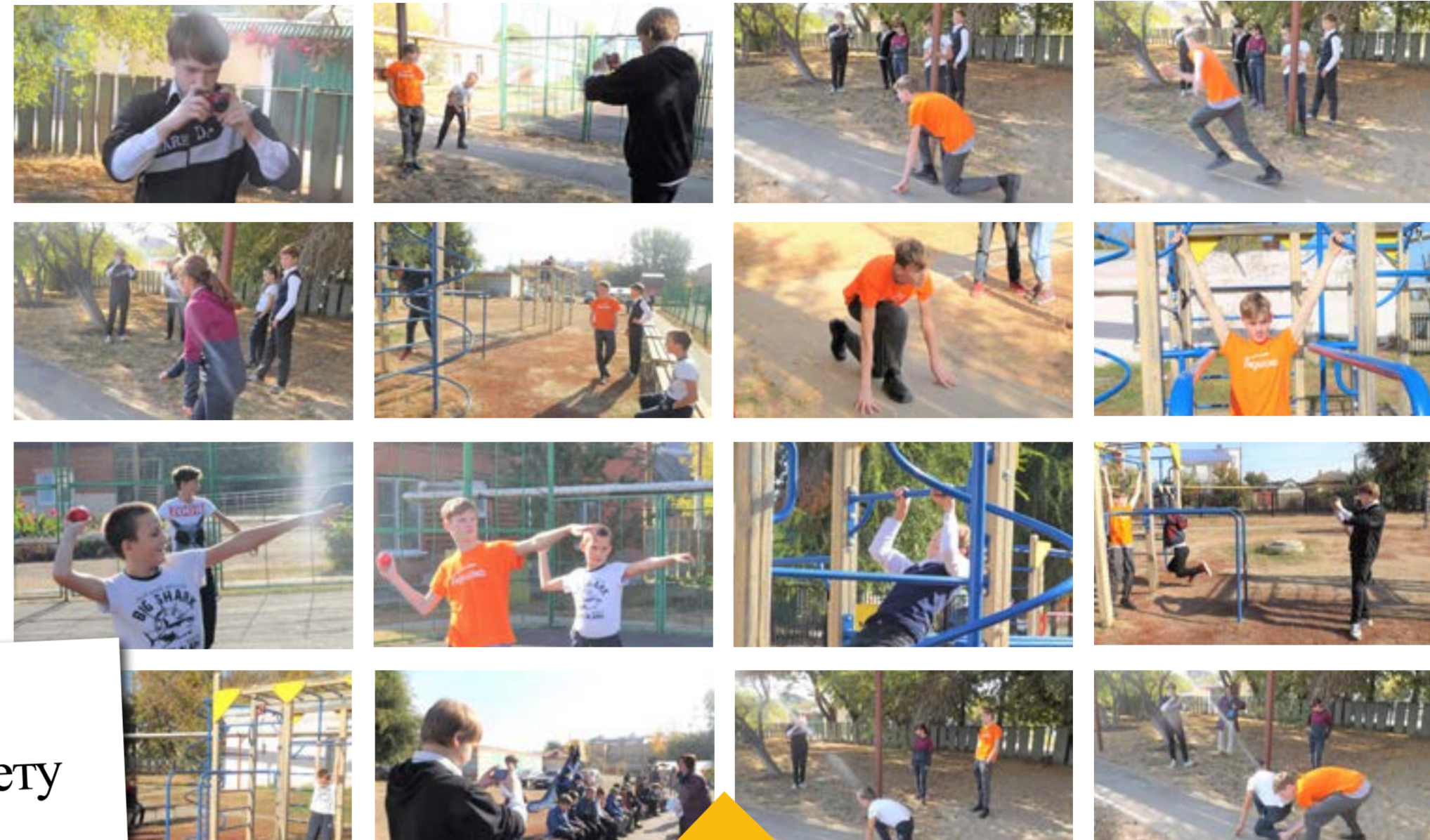
Фотограф Рома делает снимки спортивных мероприятий

*Анкетирование: Где удобнее всего заниматься спортом? Дома, в школе или на стадионе?