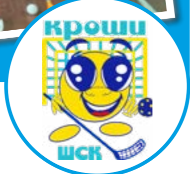
ШСК «КРОШИ» школьный спортивный клуб ГБОУ СО «Школа-интернат АОП с. Приволжское Ровенского р-на»