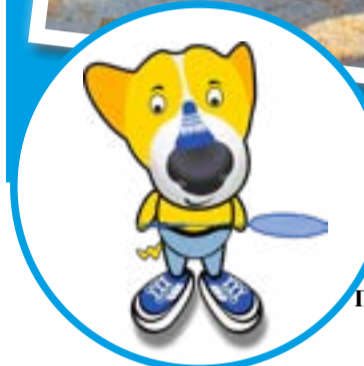
ШСК «ОЛИМПИЕЦ» школьный спортивный клуб ГБОУ СО «Школа-интернат АОП р. п. Базарный Карабулак»