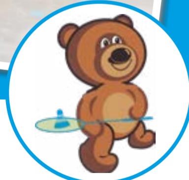
ШСК «МИШКА» школьный спортивный клуб ГБОУ СО «Школа-интернат АОП г. Маркс»