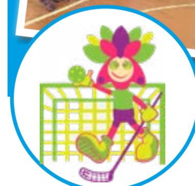
ШСК «ФЕНИКС» школьный спортивный клуб ГБОУ СО «Школа-интернат АОП №4 г. Саратов»